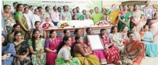
విశాఖాపటణం, సితంబర్ 11, నిఘా ఆజతక్

సిస్టర్స్ ఆఫ్ సెంట్ జోసెఫ్ కాన్గ్రెగేషన్ కి 375వీ వర్షగాఠ కే ఉపలభ్య మే, సిస్టర్స్ ఆఫ్ సెంట్ జోసెఫ్ ఆఫ్ అన్నసీ, విశాఖాపటణం ప్రావిన్స్ కే నెపత్వ మే విశ్వ రికార్డ్ బనానె కే ఉదేశ్య సె సీడ్ బాల్ నిర్మాణ కార్యక్రమం సెంట్ జోసెఫ్ కాలేజ్ మే గుర్వార కౌ ప్రాత: 10 బజె సె 11 బజె తక్ ఆయోజిత కియా గయా | ఇస్ కార్యక్రమం మే దేశంబర్ కి 16 సెంట్ జోసెఫ్ షికాగో సంస్థాం నె బాగ్ లియా ఆంర్ కుల 11,19,000 సీడ్ బాల్స్ కా నిర్మాణ కియా | సెంట్ జోసెఫ్ కాలేజ్ సె షి 1453 ఊర్-ఊర్త్రాం నె బాగ్ లెకర్