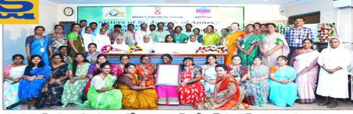
సర్దిఫెట్, ప్రశంసాపత్రంతో సెయింట్ జోసెఫ్ సిస్టర్స్, అధ్యాపకులు